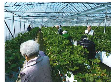
4/17 デイのイチゴ狩りの様子 (君津市小櫃の斉藤農園)