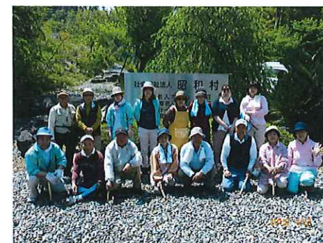
4/27 シルバー友の会のボランティア 県道進入路付近の草取り作業をして 下さいました。