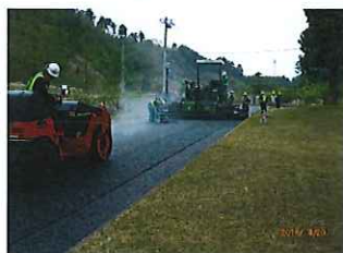
4/6～3週間の予定で、舗装道路、駐車場の改修工事が行われました。