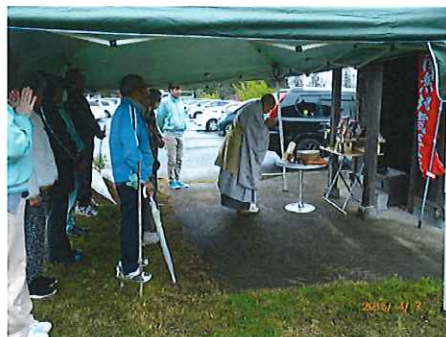
4/7 身代わり地蔵のご供養 職員駐車場の隣にあります。