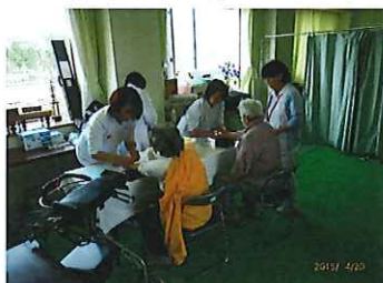
4/20 入居者、 職員健康 診断。 胸部X線 検査は、 移動検診 車で実施