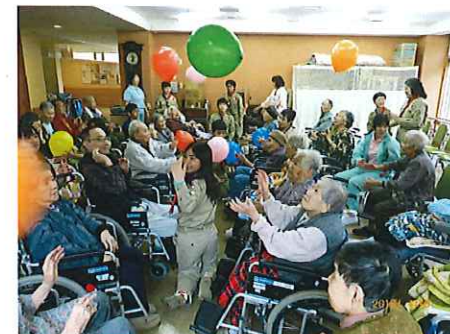
4/19 ボーイスカウト隊の訪問 レクや演芸会を楽しみました。