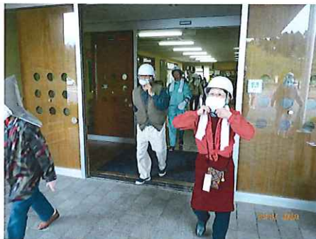
3/20 防災避難訓練の実施 3、6、9、12月の年4回実施。