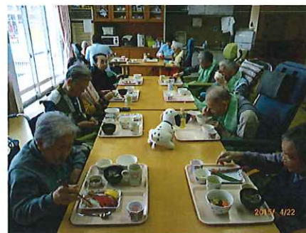
4/22 行事食の日のリビングでの様子 メニューはにぎり寿司、わらびや竹の子など。