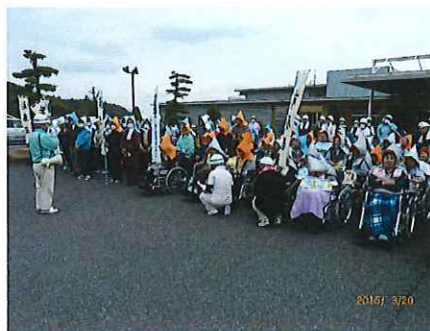
3/20 防災避難訓練の実施 市原園やデイ利用者も参加。