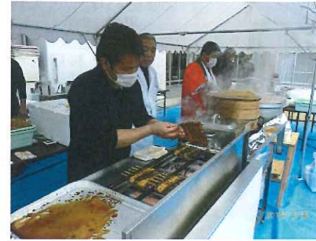
うなぎ八幡屋さん(市内潤井戸)の社長、ご子息、板長が直々に料理して下さいました。