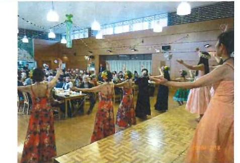
市原ハワイアンフラ協会の皆様フラダンスのご披露