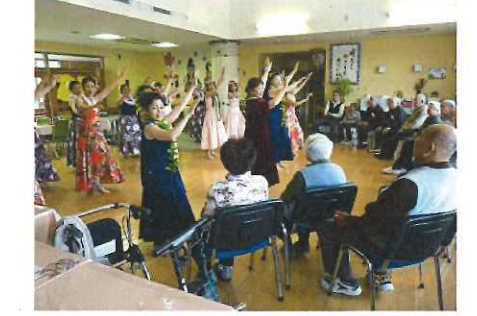
フラダンスは、デイでもご披露して下さいました。