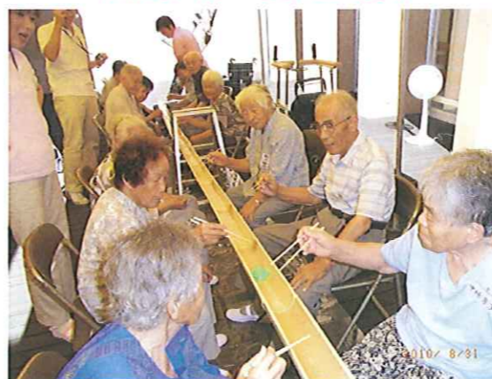
8 月 そう麺流し