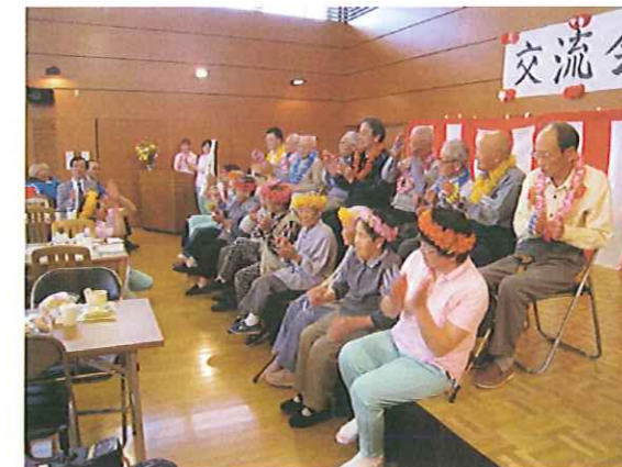
5 月 施設利用者 交流会