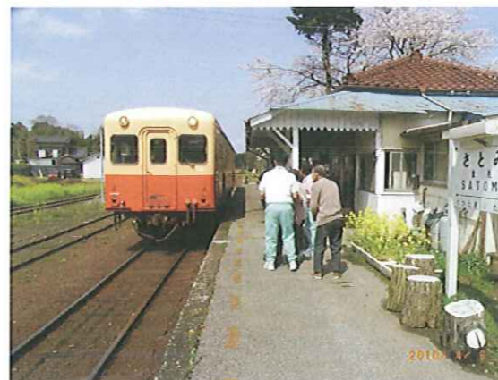
4 月 小湊鉄道の旅(里見駅~中野駅)