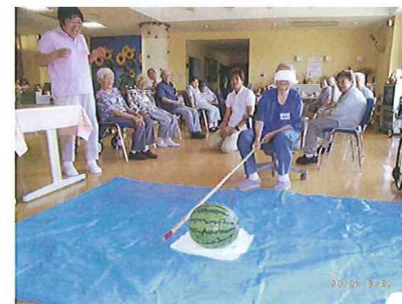
8 月 スイカ割り