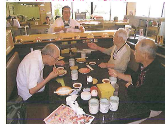
7 月 木更津の回転寿司で外食